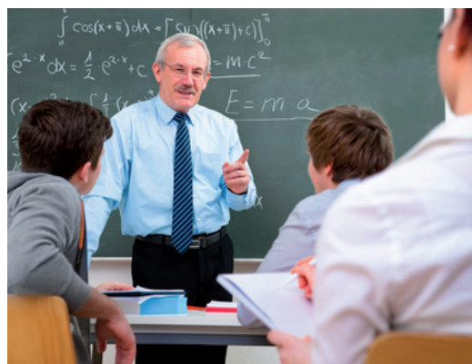
Folie #39401 425

Anders als beim Angestellten übernimmt der Dienstherr beim Beamten nicht die Hälfte der Beiträge zu einer gesetzlichen Krankenversicherung. Der Beamte erhält eine anteilige Erstattung seiner anfallenden Behandlungskosten. Die Höhe der Erstattung richtet sich nach seinem jeweiligen Beihilfesatz. Die Höhe des Satzes ist abhängig von den jeweiligen Beihilfevorschriften – kinderreiche Beamte und Pensionäre erhalten eine höhere Erstattung. Auch Ehegatten und Kinder eines Beamten haben über diesen grundsätzlich einen Anspruch auf Beihilfe (keine eigene Krankenversicherung bzw. noch vorhandene Kindergeldberechtigung vorausgesetzt).